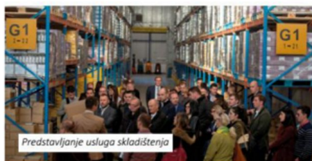
Predstavljanje usluga skladištenja