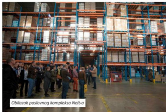
Obilazak poslovnog kompleksa Nelt-a

Kompanija NELT je ove godine postala članica Evropske mreže za distribuciju prehrambenih proizvoda (The European Food Network) na čijem je čelu kompanija DACHSER. Mreža pokriva 34 zemlje EU i raspolaže sa oko 1,74 miliona kvadratnih metara prostora za skladištenje hrane i oko 10 500 kamiona hladnjača.