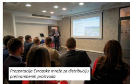
Prezentacija Evropske mreže za distribuciju prehrambenih proizvoda